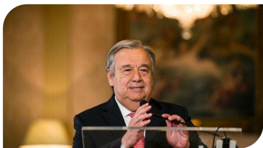
联合国秘书长古特雷斯

新华社联合国 11 月 10 日电，联合国秘书长古特雷斯 10 日在赴德国波恩参加联合国气候变化会议前发出呼吁，希望国际社会采取更加积极的行动应对气候变化。