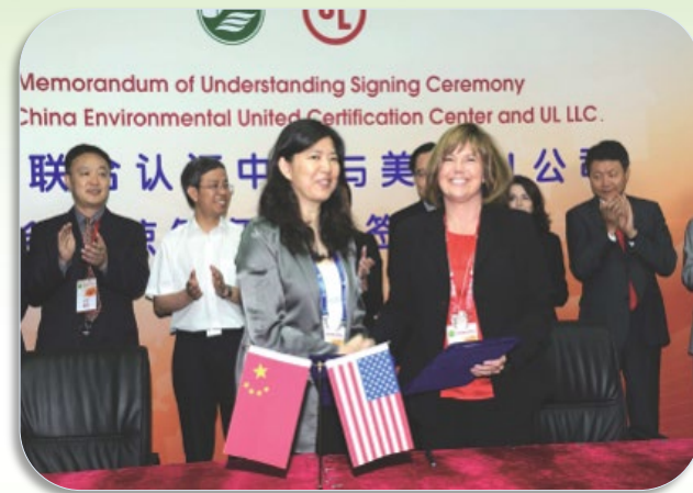
中加（加拿大）环境联委会