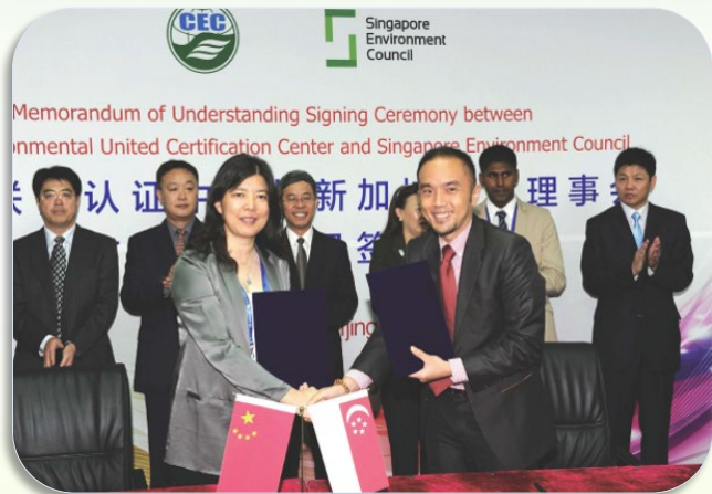
中新（新加坡）联委会